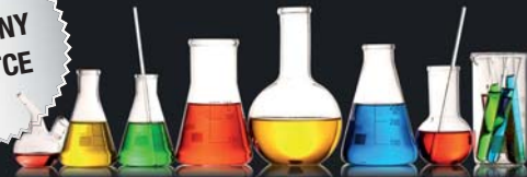
Colour Liquid Aquarell Bio-Pigment

10 ml, dostępne w zestawie lub oddzielnie