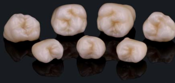
po procesie synteryzacji