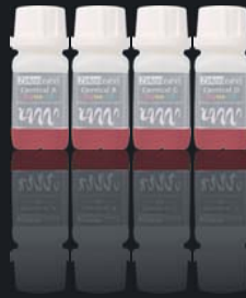
Colour Liquid Prettau® Aquarell Cervical A-D

20 ml lub 50 ml, dostępne w zestawie lub oddzielnie